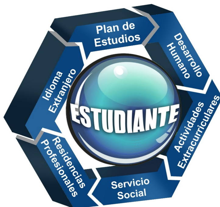
Modelo de Formación Académica